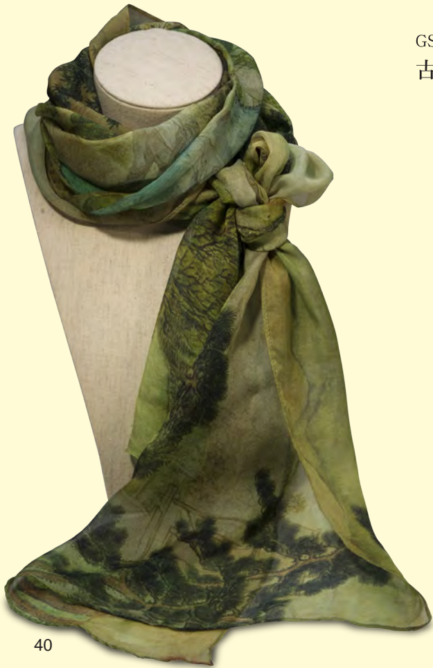
GSJN00000198 古代绘画系列艺术丝巾