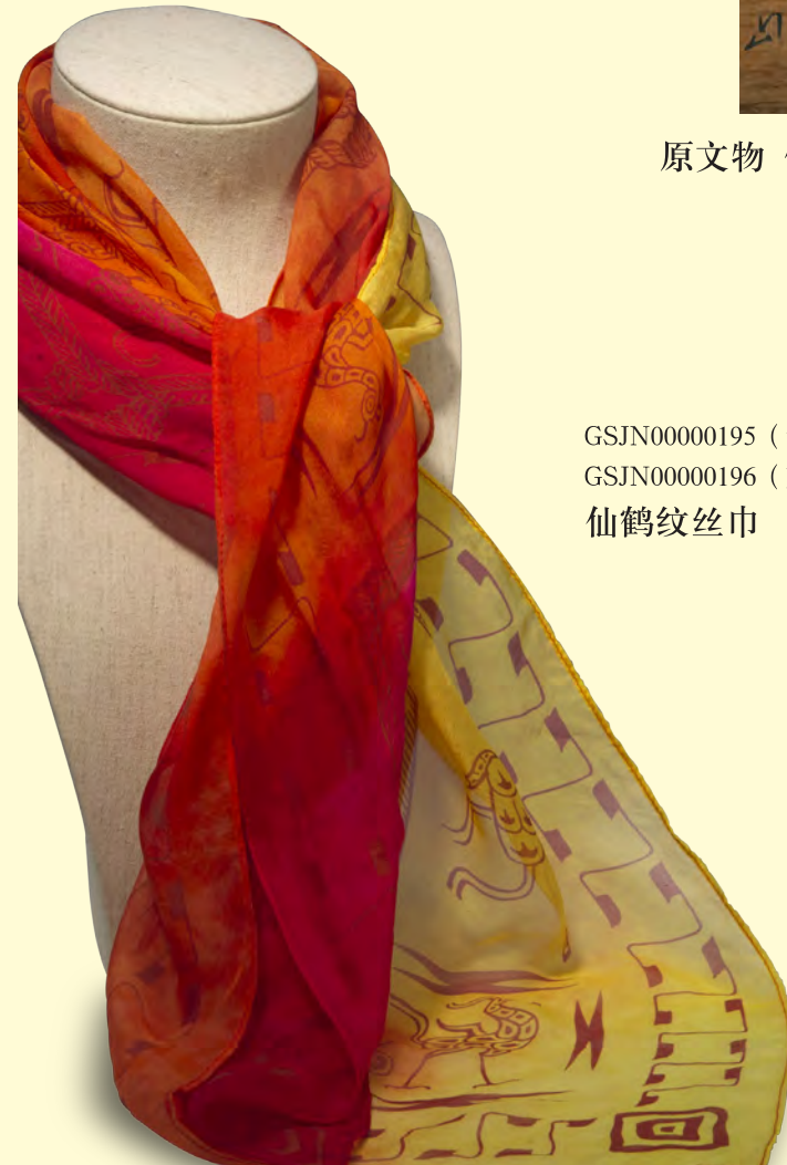
GSJN00000195 (红) GSJN00000196 (蓝) 仙鹤纹丝巾