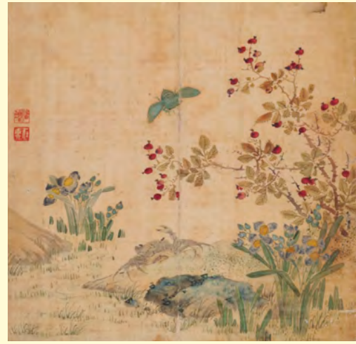
原文物 明潘璿《花鸟册》