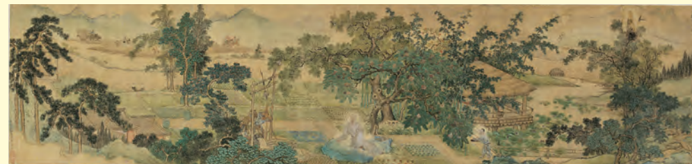
原文物 清禹之鼎《南垞灌蔬图》